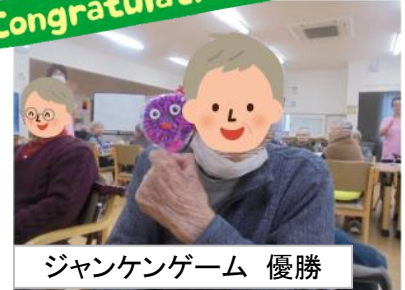
ジャンケンゲーム 優勝